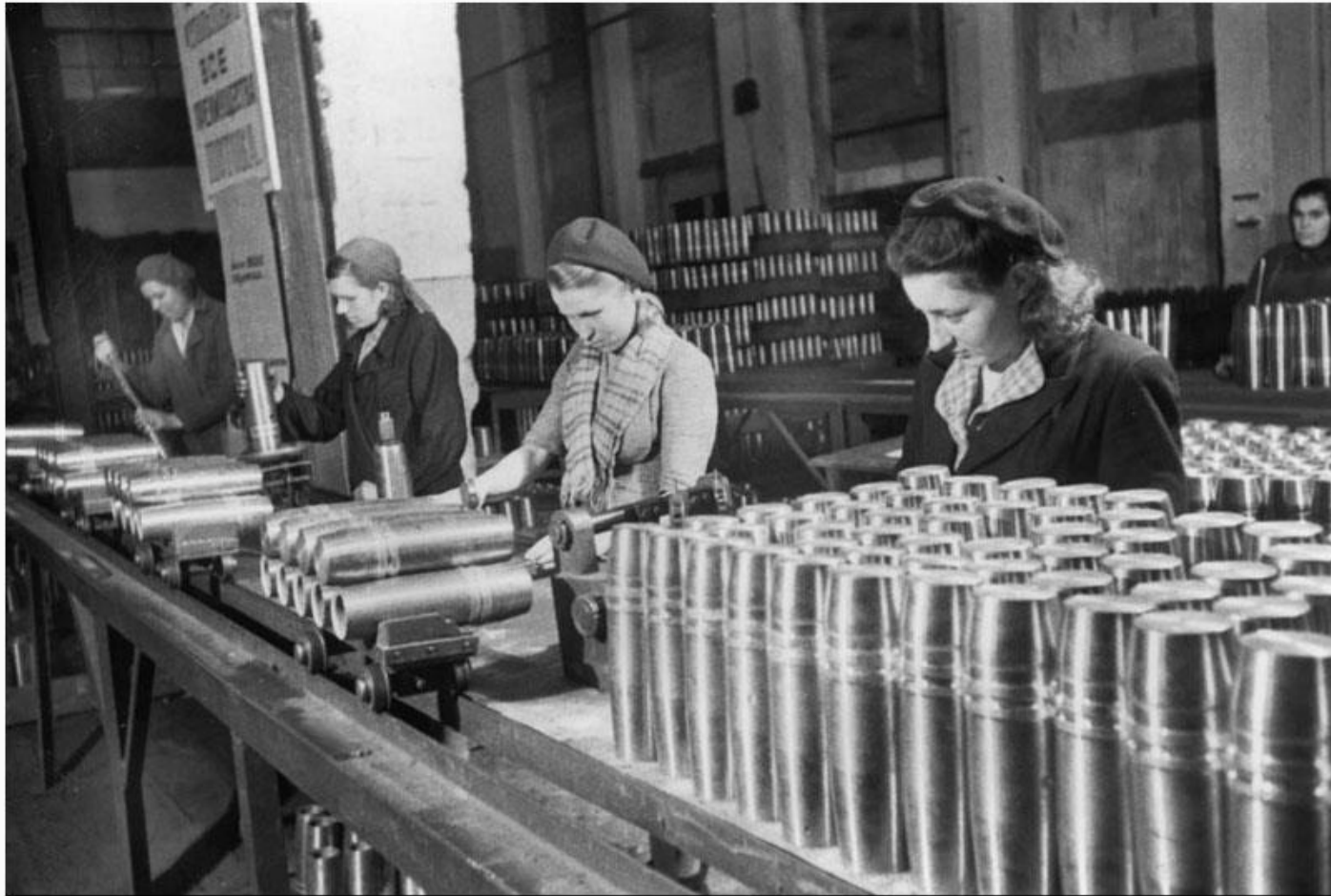
Изготовление артиллерийских снарядов.

Война явилась к южноуральцам вместе с бессонными трудовыми сменами в холодных цехах, с эшелонами раненых и эвакуированных, голодным детством и с долгожданнами и такими родными письмами-треугольничками с фронта.